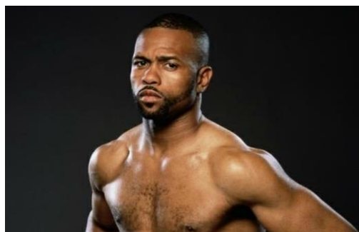
Americký boxer Roy Jones Jr